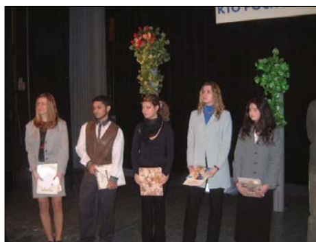
Předávání cen vítězům soutěže „Slovenská fantastická bota“ v Partizánském