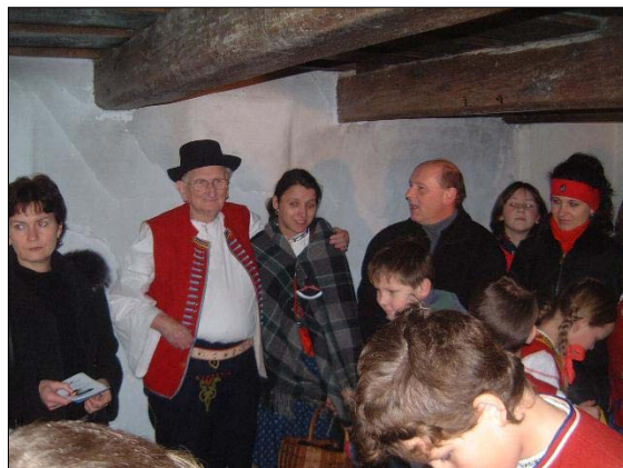
Mikulášský jarmek v dřevěnici