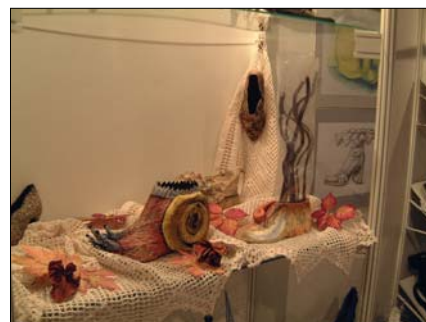
Společný stánek SPŠ Partizánské a NJP na veletrhu Intershoe v Bratislavě