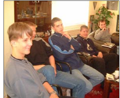
Vyhlášení výsledků soutěže „Ševče, drž se svého kopyta 2001“