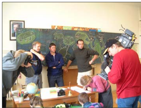
Štáb televize Nationale Geographic natáčí v v ZŠ Šanov - Divnice