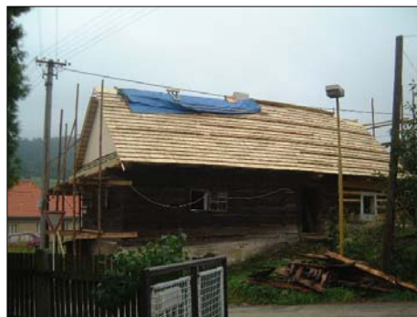
Stav roubeného domu v srpnu 2001